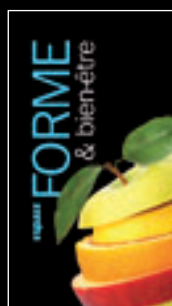
Des Kakemonos par secteur d'activité