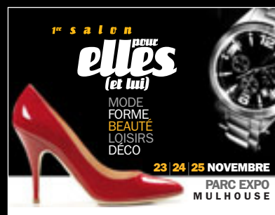
Affichage 4X3 m

VENDREDI ET SAMEDI DE 10H À 23H - DIMANCHE DE 10H À 19H